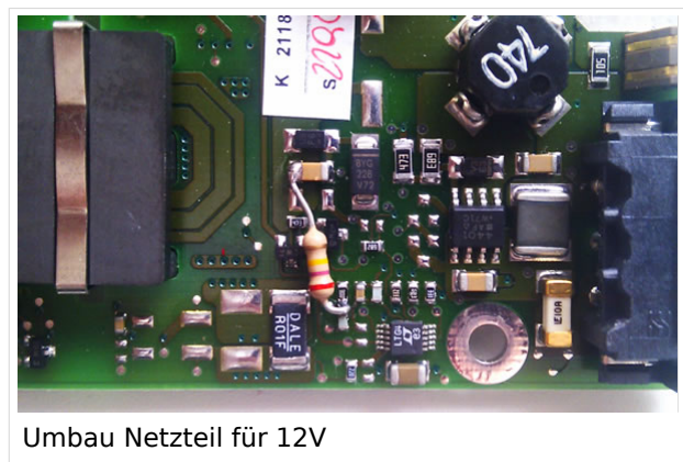
Umbau Netzteil für 12V

Die Versorgung erfolgt erdfrei und wird an dem dreipoligen Stecker eingespeist. Dabei befindet sich, wie in der Abbildung ersichtlich, der Pluspol von der Anschlußseite gesehen ganz rechts (der Pin näher zu den USB Buchsen), der Minuspol ganz links. Der mittlere Pin wäre für die Erdung des Gehäuses vorgesehen.