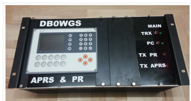
DB0WGS APRS & PR Digi

Weitere Tests laufen unter anderem in OE1, OE3, OE6, OE7 und OE9, sowie in IK, DL und PA.