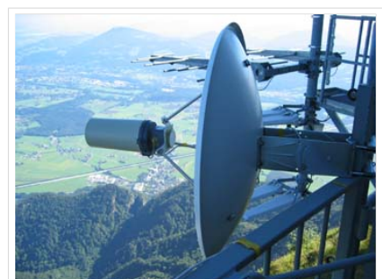
Link Zugspitze - Landeck