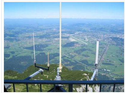
Link Zugspitze - Innsbruck