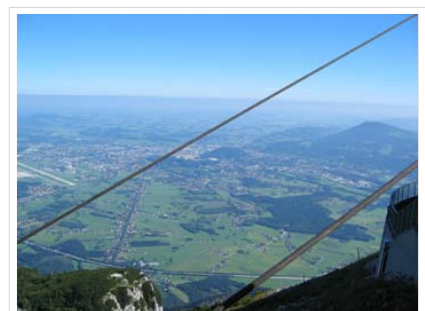
Auffahrt zu Untersberg