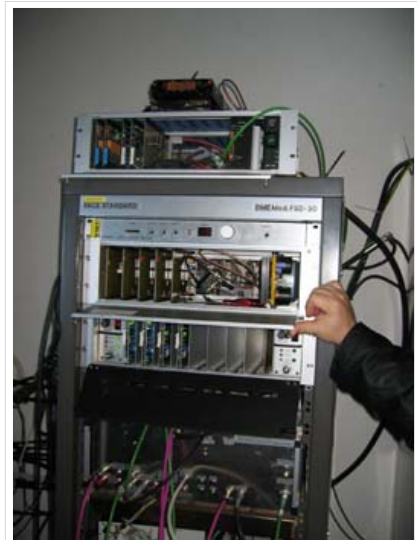
Empfang Zugspitze in HB9