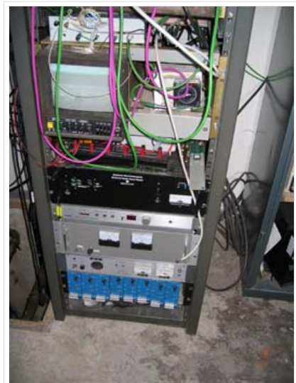
Empfang Zugspitze in HB9